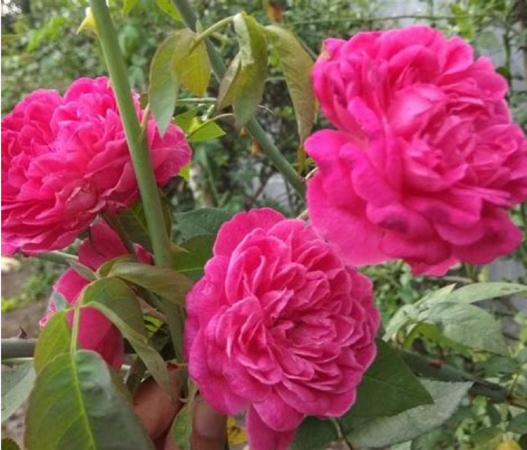
Lirik lagu bunga bunga rindu dian piesesha. Lirik lagu bunga bunga rindu dangdut.